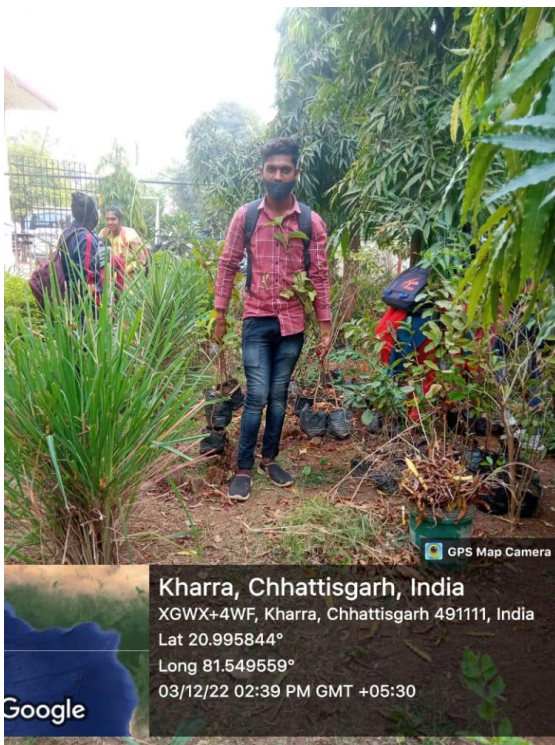
NSS Cleanliness Awareness Program- - date 03.12.2022