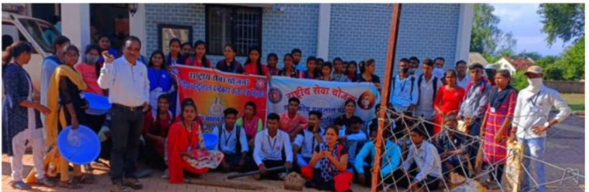
Cleanliness Awareness-PRESS REPORT-Patan-15.10.2022