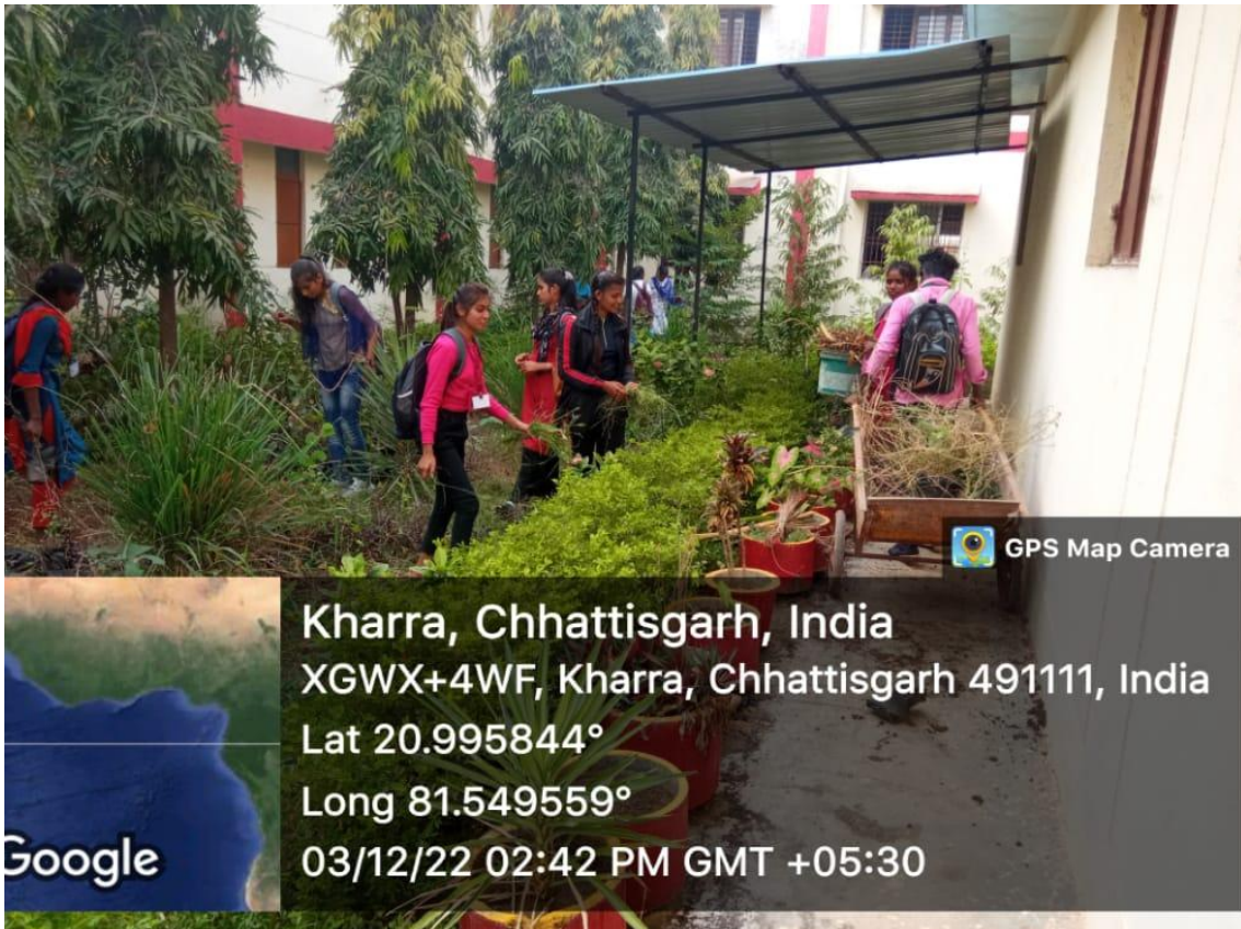
NSS Cleanliness Awareness Program- -date 03.12.2022