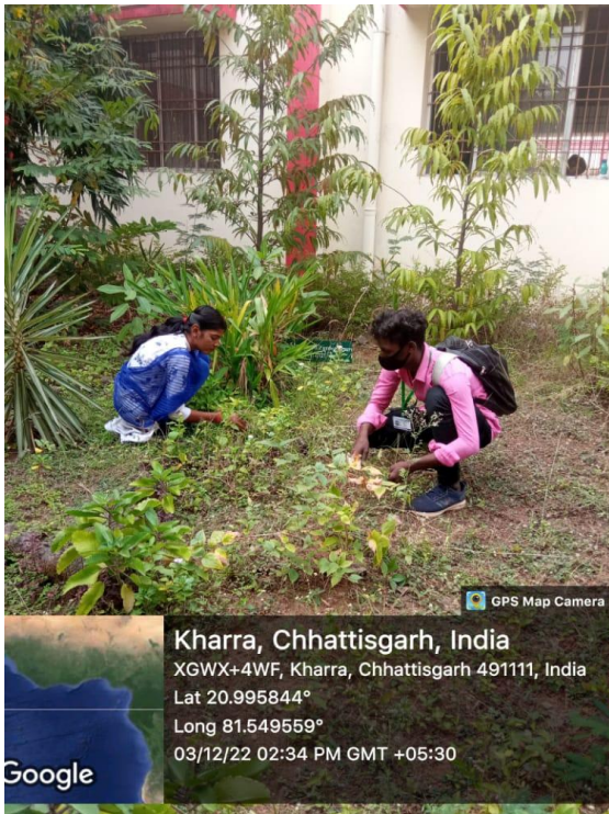
NSS Cleanliness Awareness Program- -