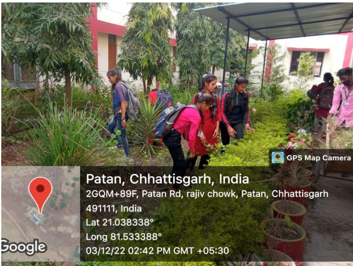
.NSS Cleanliness Awareness Program- -date 03.12.2022