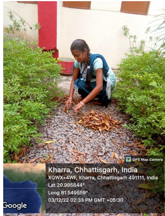
NSS Cleanliness Awareness Program- - date 03.12.2022