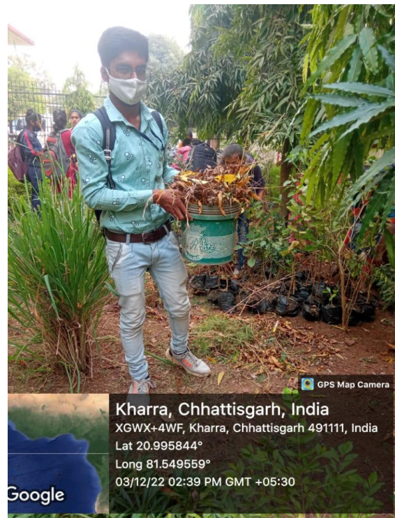
NSS Cleanliness Awareness Program- -